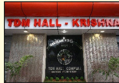
Krishana AC Hall

Ernakulam Karayogam, T.D.M. Hall Complex, D. H. Road, Kochi, Kerala, India- 682 016