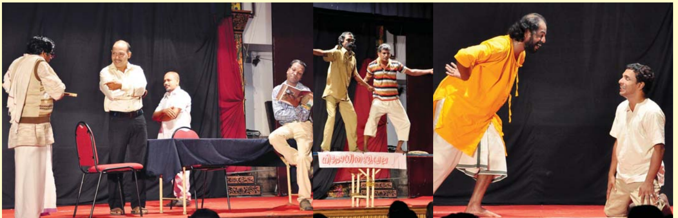
എറണാകുളം കരയോഗത്തിന്റെ സഹകരണത്തോടെ ബീമിന്റെ പ്രതിമാസപരിപാടിയായ തൃശൂർ നാടകസംഘം അവതരിപ്പിക്കുന്ന തിയറ്റർ സ്കെച്ചിന്റെ വിവിധ ദൃശ്യങ്ങൾ