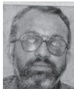
എൽ/2625 എം.ജി. ഇന്ദുചൂഡൻ പത്മനാഭനിവാസ്, കാരിക്കാമുറി II കോസ് റോഡ് കൊച്ചി - 682 011