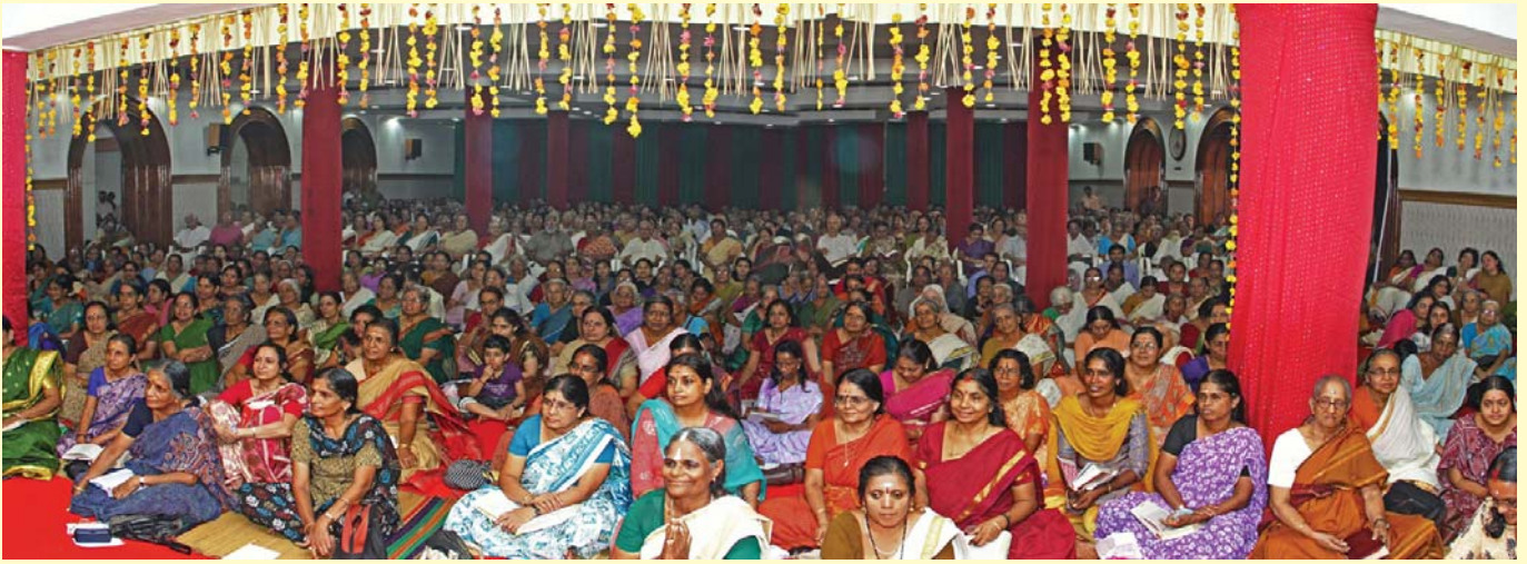
26-ാമത് ശ്രീമദ് ഭാഗവത സപ്താഹയജ്ഞ സദസ്സ്