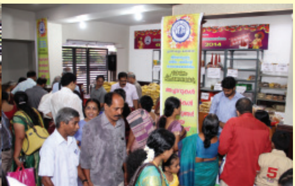
2014-ലെ എറണാകുളം കരയോഗത്തിന്റെ ഓണം ഫെയർ