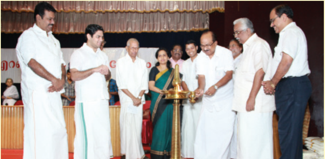
2014 ലെ ജീവകാരുണ്യ പ്രവർത്തനങ്ങളുടെ ഭാഗമായി ധനസഹായ വിതരണോത്ഘാടനം മുൻ കേന്ദ്ര മന്ത്രി പ്രൊഫ. കെ.വി. തോമസ് എം.പി. ഉദ്ഘാടനം ചെയ്യുന്നു.