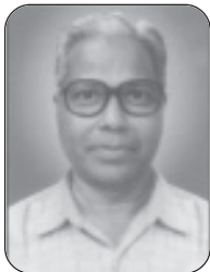
എൽ/ 1014 കുമാരൻ നായർ ജാനകി മന്ദിരം രവിപുരം റോഡ്, കൊച്ചി 682016