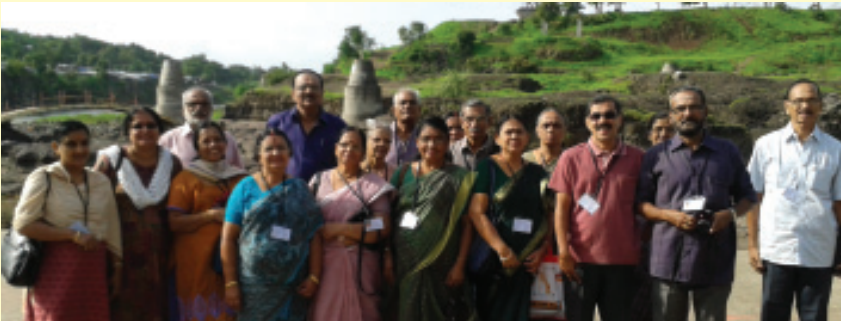
എറണാകുളം കരയോഗത്തിന്റെ നേതൃത്വത്തിൽ നടത്തിയ ഷിർട്ടി, അയോദ്ധ്യ, കാശി തീർത്ഥയാത്രാ സംഘാംഗങ്ങൾ