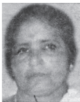
എൽ/2046 സരസ്വതി അമ്മ കെഴുപ്പിള്ളിൽവീട്, കടവന്ത്രം, കൊച്ചി 20