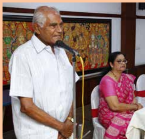
എറണാകുളം കരയോഗം വൃമൺസ് ഫോറം 50-ാമത് യോഗം