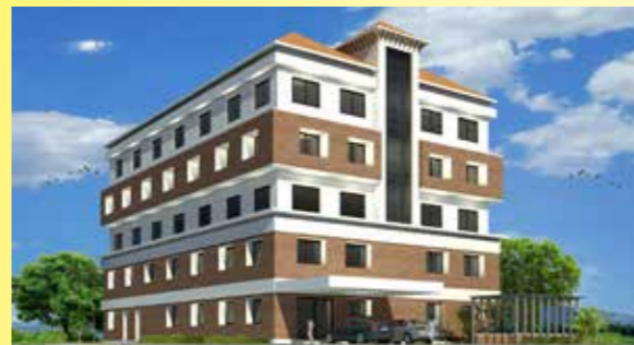
നിർമ്മാണ പ്രവർത്തനങ്ങൾ പൂരോഗമിക്കുന്നു....