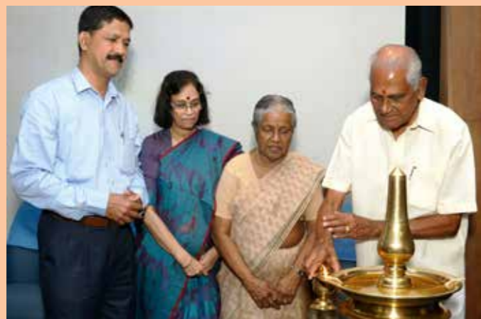
ചൈത്രം കൗൺസിലിംഗ് സെന്ററിന്റെ പരിശീലന സെമിനാർ കരയോഗം പ്രസിഡന്റ് കെ പി കെ മേനോൻ ഉദ്ഘാടനം ചെയ്യുന്നു