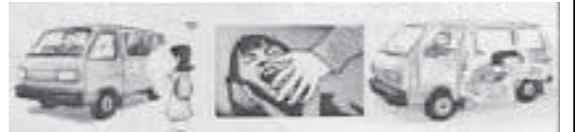
പ്രിയരേ, യാചകരെന്ന വ്യാജേന നമ്മുടെ നാട്ടിലിറങ്ങിയ കപടൻമാർക്കെതിരെ ഒന്നിച്ച് കൈകോർക്കാം. മക്കളുടെ സുരയ്ക്കായി ഒരുമിച്ച് പോരാടാം...

പാല് കൊടുത്ത കൈക്ക് തിരികെ കൊടുത്ത യാചകർ നമ്മുക്ക് വേണ്ട. ഞാനും പിന്തുണക്കുന്നു.