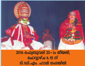
2016 ഫെബ്രുവരി 23-ാം തീയതി, ഫെബ്രുവരി 6.15 ന് ടി.ഡി.എം. ഹാൾ ഗംഗയിൽ

കഥാസാരം : ദേവരക്ഷയ്ക്കായി ദേവൻമാർ ഗുരു സുതനായ കച്ചനെ ഉപായത്തിൽ ശുക്രമഹർഷിയിൽ നിന്ന് മുതസഞ്ജീവനി കരസ്ഥമാക്കാനായി അയയ്ക്കുന്നു. കച്ചൻ മഹർഷിയിൽ നിന്നും വിദ്യകൾ പഠിച്ച് താമസിക്കുമ്പോൾ, മഹർഷിയുടെ പുത്രിയായ ദേവയാനി കച്ചനിൽ അനുകരണയാകുന്നു. കച്ചൻ സഹോദരിയെപ്പോലെ മാത്രമേ ദേവയാനിയെ കണ്ടിരുന്നുള്ളൂ. ഒരു ദിവസം കാലികളെ മേയ്ക്കാനായി കാട്ടിൽപോയ കച്ചനെ സുകേതു എന്ന അസുരൻ വെട്ടിക്കൊന്ന് മദ്യത്തിൽ കലക്കി ശുക്രമുനിക്ക് സമ്മാനിക്കുന്നു. സന്ധ്യയായിട്ടും കച്ചനെ കാണാതെ ദേവയാനി വിഷമിക്കുന്നു. അപ്പോൾ മദ്യം കഴിച്ച കാര്യം ഓർത്ത മഹർഷി കച്ചൻ തന്റെ വയറ്റിൽ ഉണ്ടെന്ന് ഓർക്കുന്നു. ദേവയാനി കച്ചനേയും വേണമെന്ന് നിർബന്ധം പിടിക്കുന്നു. മഹർഷി വയറ്റിൽ കിടക്കുന്ന കച്ചന് മുതസഞ്ജീവനി മന്ത്രം ഉപദേശിക്കുന്നു. ശുക്രന്റെ വയർ പിളർന്ന് കച്ചൻ പുറത്തേക്ക് വരുന്നു. കച്ചൻ ഗുരുദക്ഷിണയായി മന്ത്രം ഗുരുവിൽ പ്രയോഗിക്കുന്നു. കച്ചൻ അവിടെ നിന്നും പോകാൻ തുടങ്ങുമ്പോൾ പാണിഗ്രഹണ കാര്യം ദേവയാനി പറയുന്നു. പക്ഷെ കച്ചൻ സഹോദരിയെപ്പോലെയെന്ന് നീ എന്നും എന്ന് ഓർമ്മിപ്പിക്കുന്നു. എന്നാൽ പഠിച്ച വിദ്യകൾ വിഫലമാകട്ടെ എന്ന് ദേവയാനിയും ബ്രഹ്മകുലത്തിൽ പിറന്ന ആര്യം നിന്നെ വിവാഹം ചെയ്യുകയില്ലെന്ന് കച്ചൻ തിരിച്ച് ദേവയാനിയെയും ശപിക്കുന്നു. അങ്ങിനെ ഏകോദരസഹോദരൻമാരെ പോലെ പെരുമാറിയിരുന്ന ആ യുവമിഥുനങ്ങളുടെ വേർപാട് ഉണ്ടാകുന്നു.