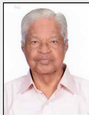
അഡ്വക്കേറ്റ് എം. സി. സെൻ എൽ / 2082 സി. എസ്. മേനോൻ കോളനി കളത്തിപറമ്പിൽ റോഡ്, കൊച്ചി 682016