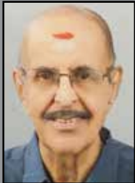
കൃഷ്ണമൂർത്തി ചേന്നാട്ട് P/1206, പ്രിയദർശിനി ചിറുർ റോഡ്, കൊച്ചി-35