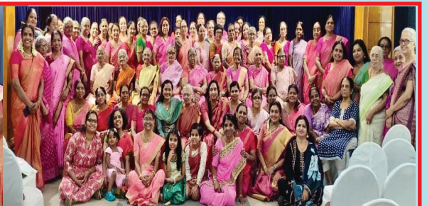
എറണാകുളം കരയോഗം വുമൺസ് ഫോറം സംഘടിപ്പിച്ച വനിതാ ദിനാഘോഷത്തിൽ നിന്ന്

എറണാകുളം കരയോഗം കഥകളി ക്ലബ്ബ് പ്രതിമാസ പരിപാടി ഏപ്രിൽ 16 ചൊവ്വാഴ്ച വൈകുന്നേരം 6.30ന് ടി.ഡി.എം. ഹാളിൽ