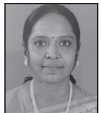
വനജ നമ്പ്യാർ L/1267 മാണിക്കത്ത് ഹൗസ് Opp. BEML Water Tank, Brook field, Bangalore - 560066