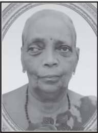
സരോജിനി P3960 ഉദയകോളനി ഗാന്ധിനഗർ കൊച്ചി - 20