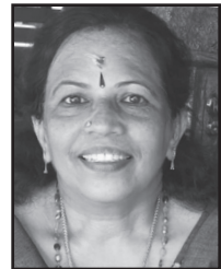
ഭാഗ്യപത്മം, എൻ. L/5202 തെക്കും ചേരിൽ വീട് പാഴൂർ മഹാദേവക്ഷേത്രത്തിനു സമീപം പാഴൂർ. പി.ഒ. പിറവം എറണാകുളം ജില്ല

സ്പഷ്ടം വിഭോനിന്റെയും പാസനത്തി നിഷ്ടം സുഖം നീ മമ നല്കീടണം. അഷ്ടാംഗയോഗത്തെ വഹിച്ചു ഞാൻ നിൻ തൃഷ്ടിക്കു സൽഭംജനമായ് ഭവിക്കാം. -ഭാഷാനാരായണീയം