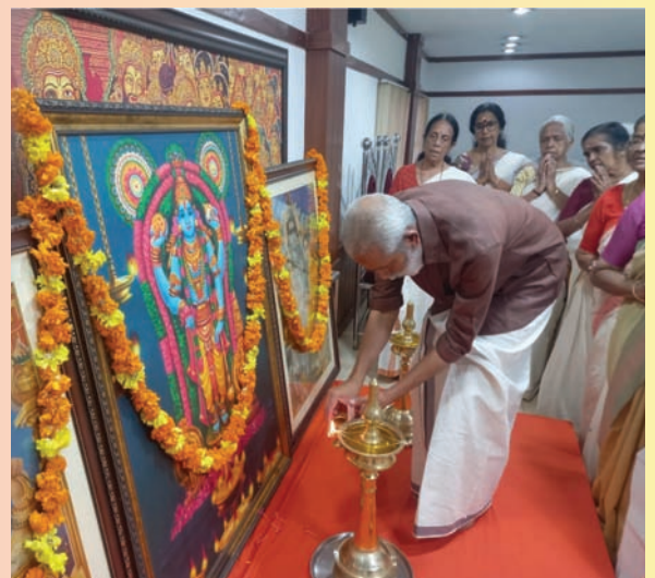
1198ലെ നാരായണീയ ദിനത്തിൽ (ഡിസംബർ 14) ടി.ഡി.എം. ഹാളിൽ നടന്ന നാരായണീയപാരായണത്തിൽ നിന്ന്