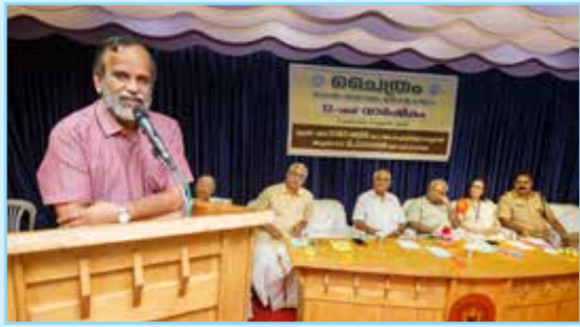
ചൈത്രം 12-ാമത് വാർഷികാഘോഷ ചടങ്ങിൽ ഡോ.വി.പി. ഗംഗാധരൻ മുഖ്യപ്രഭാഷണം നടത്തുന്നു.