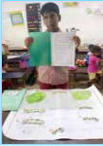
സംസ്ഥാന സ്കൂൾ പ്രവൃത്തിപരിചയമേളയിൽ എ ഗ്രേഡ് കരസ്ഥമാക്കിയ രുദ്രവിലാസം യു പി സ്കൂളിലെ കുട്ടികൾ