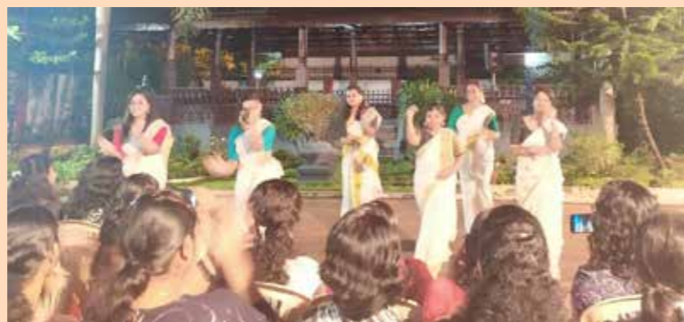
ടിഡിഎം ഹാളിലും പ്രശാന്തി വനിതാ ഹോസ്റ്റലിലും നടന്ന ഓണാഘോഷം 2019 ൽ നിന്ന്