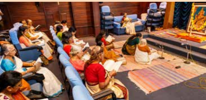
എറണാകുളം കരയോഗത്തിന്റെ നവരാത്രിയാഘോഷത്തോടനുബന്ധിച്ച് ടി ഡി എം ഹാളിൽ നടന്ന ശ്രീമദ് ദേവിഭാഗവത പാരായണം