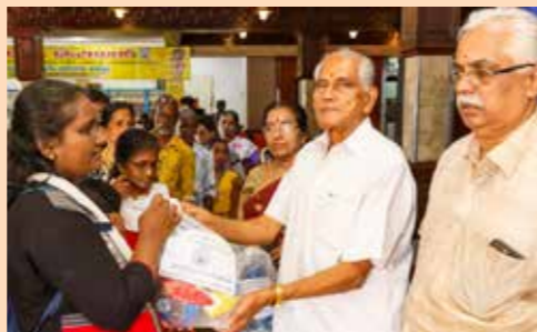
എറണാകുളം കരയോഗത്തിന്റെ സാമൂഹ്യ സേവനവിഭാഗത്തിന്റെ ആഭിമുഖ്യത്തിൽ നിർമ്മനരായ കിടപ്പുരോഗികളുടെ കുടുംബാംഗങ്ങൾക്കുള്ള ക്ഷേമപുസ്തകം കീറ്റ് വിതരണം