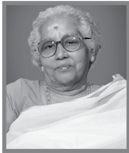
പാരിജാതം. ജി. മേനോൻ മേലങ്ങത്ത് ആലപ്പാട് റോഡ് രവിപുരം, കൊച്ചി - 682016