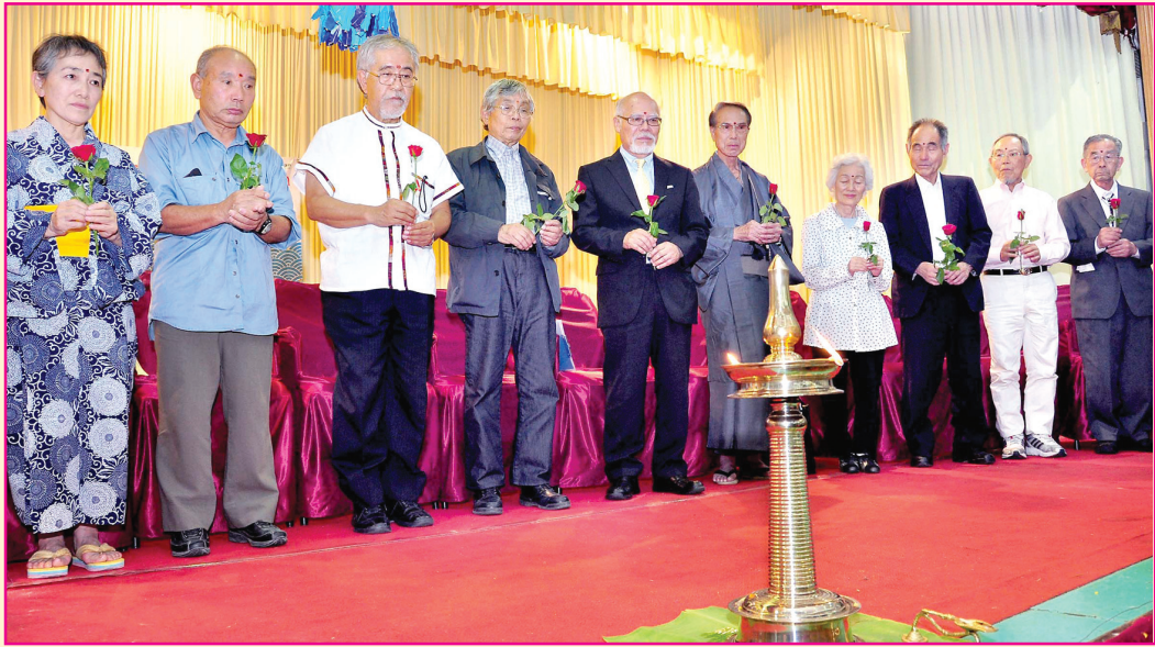
എറണാകുളം കരയോഗത്തിന്റെ സഹകരണത്തോടെ ബാങ്ക് ജീവനക്കാരുടെ സംഘടനയായ ബീം - ഹിരോഷിമ സംഘത്തിനു നൽകിയ സ്വീകരണത്തിന്റെ ദൃശ്യം