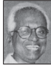
എൽ/388 ഐ. വേണുഗോപാൽ ഈയ്യാട്ടിൽ ഹൗസ്, ചിറ്റൂർ റോഡ്, കൊച്ചി-11